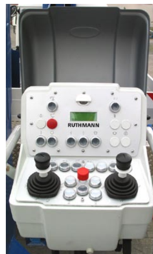
Anton Ruthmann GmbH & Co. KG

P.O.Box 12 63 D-48705 Gescher-Hochmoor GERMANY